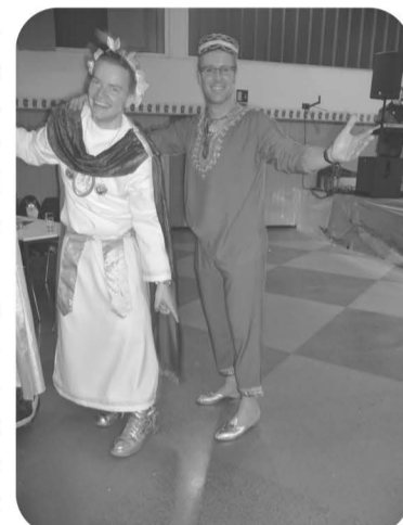
Sein Markenzeichen - Extravagantes Kostüm und Schuhe