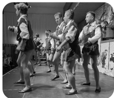
„Echte Männer mit grünen Nylons“

So setzte man sich über die Kleiderordnung hinweg, zog statt Hosen und Gamaschen grüne Strumpfhosen und Tanzschlappchen über. Dieses Braun-Grüne Tanzgeschwader eroberte auf der Bühne natürlich alle Frauen