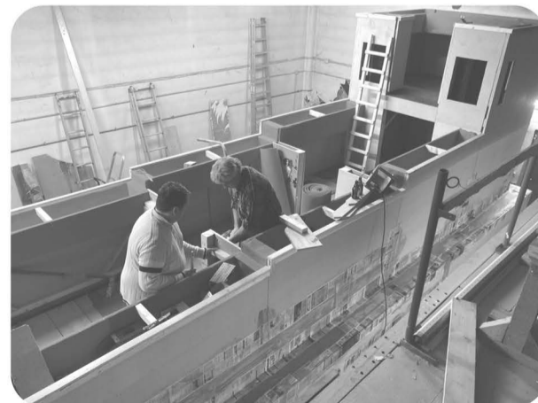
11er Ratwagen - „Innenausbau“

Schön, dass wir alle an einem so wichtigen Thema für unser Dorf mitgearbeitet haben. Wir können alle stolz darauf sein, dass wir unser karnevalistisches Kulturgut im Wiedtal weiter pflegen können. Allen sei hier ein herzliches Dankeschön gesagt und ein Dreimal von Herze kommdendes: „Rot-Blau HELAU“.