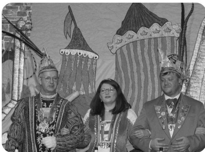
Gerne wurde auch mal geschunkelt

Auftritte gab es jedenfalls viele in der Session 2023. Was bleibt sind tolle Erinnerungen und Begegnungen. Mir persönlich ist dabei aufgefallen, dass es meist auch die kleinen Dinge sind, die einem das karnevalistische Herz höher schlagen lassen. Dann, wenn man singend am Abend an der Theke steht, sich beim Nachbarn einhakt und schunkelnd die großartigen Tage Revue passieren lässt.