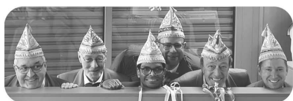
Immer für einen Scherz zu haben ... mit Spaß an de Freud!

Was uns gefällt? Für uns sind die beiden echte Vorbilder, teils gelassen, wenn es mal hoch hergeht, nach dem Motto: „Ruhig bleiben, wir machen das schon“. Andererseits für jeden Spaß zu haben, denn mit ihren kreativen Ideen beleben sie unser Dorfleben. Jungs, wir sind dankbar, euch in unserer Mitte zu wissen. Herzlichen Dank für eurer Engagement bei unserem Rot-Blauen Verein. (-TK/MM-)